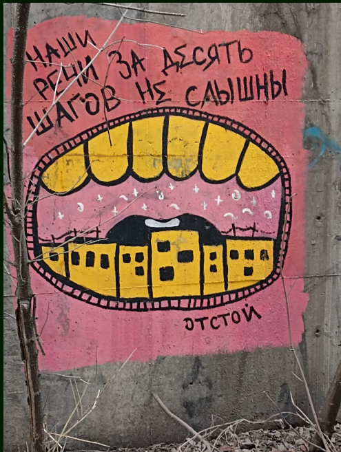
2023-02-11-123702 Крупный план наскальной живописи