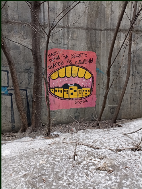
2023-02-11-123652 Наскальная живопись