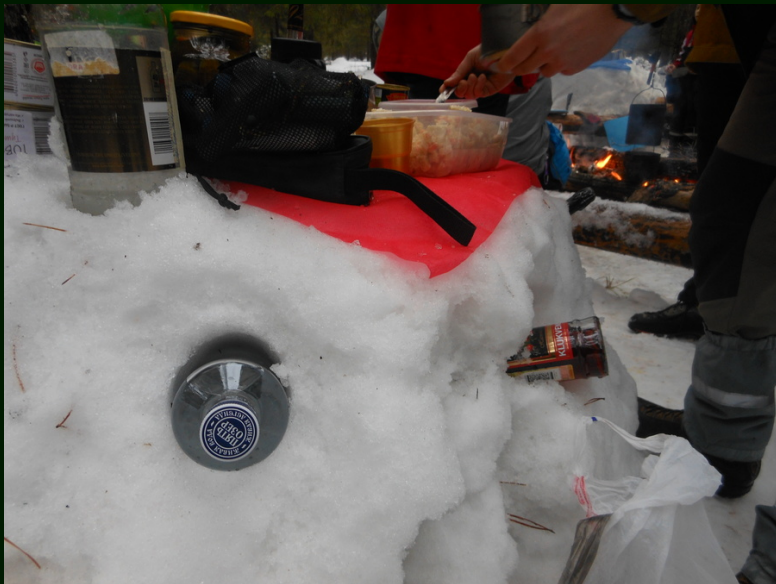
2015-02-28-5378 Наш бар