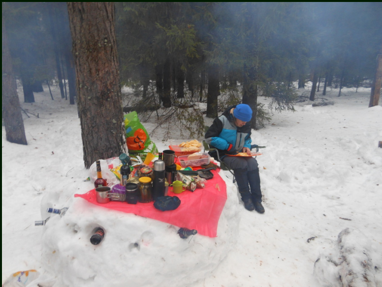
2015-02-28-5340 А тут уже режут сыр к коньяку