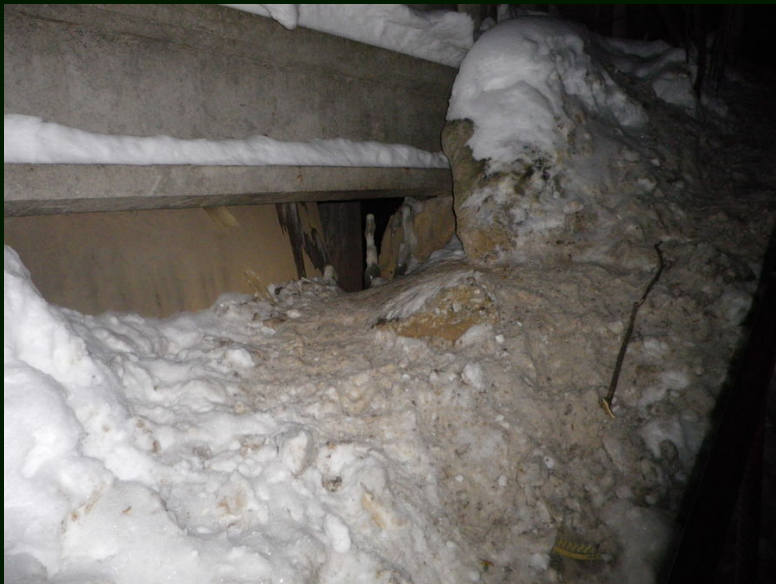
2013-01-25-8644 Наше внимание привлёк стологмит, торчавший в дырке под забором