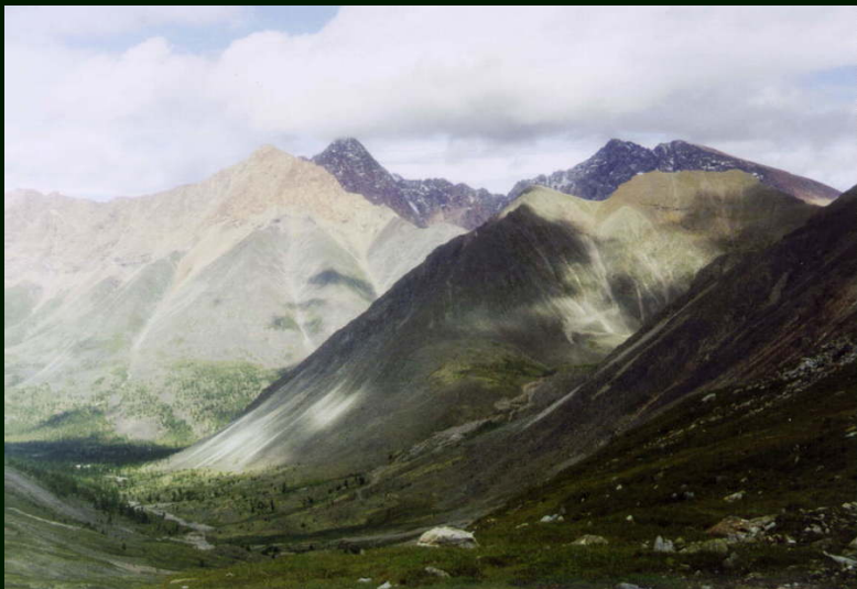
00-5-01 В долину реки Онот с перевала Онотский