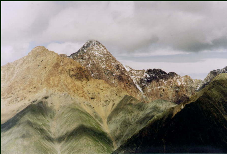
00-5-07 г. Оспин-Улан-Сардык с перевала Онотский