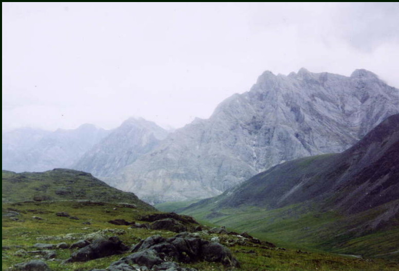
00-4-05 Недалеко от озера у пер. Богохонголдойский. Вид на ю-з