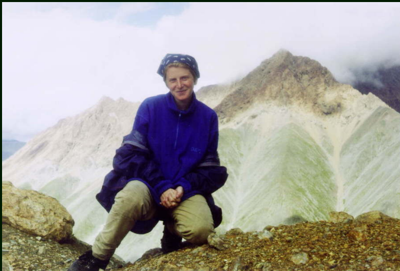
00-5-16 Индивидуальная гора сзади