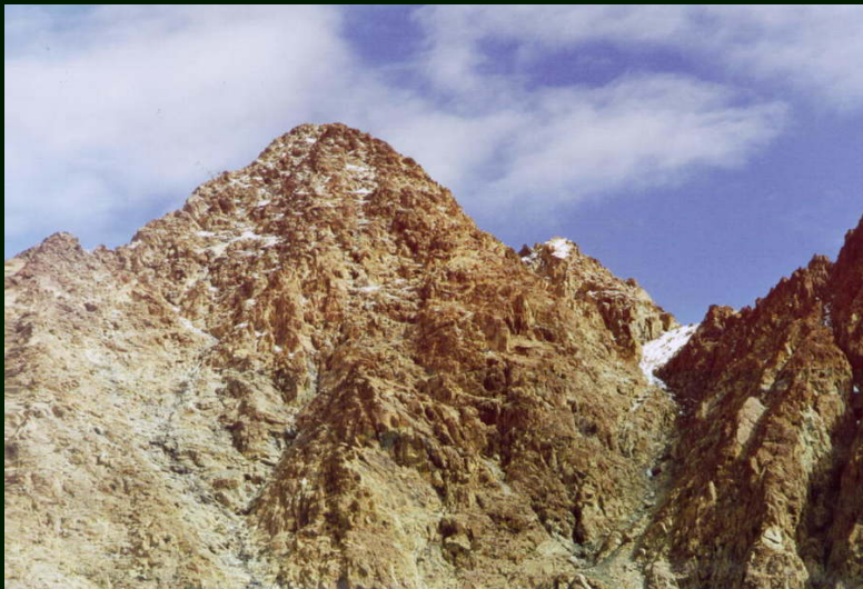
00-5-33 г. Оспин-Улан-Сардык (снизу вверх)