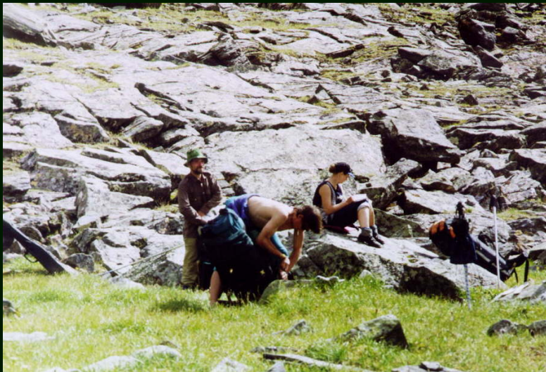
00-4-14 После обеда под пер. Богохонголдойский