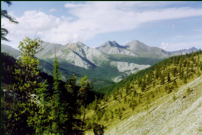
00-6-15 Китайские гольцы из р. Жалга