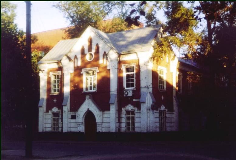
00-7-13а Иркутск. Вроде больница в районе ул. Марата