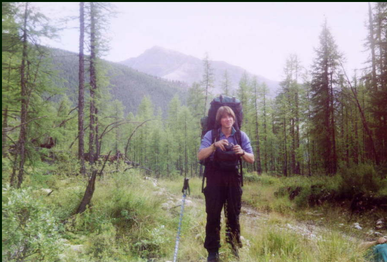
00-4-27 Эшелончик улыбается