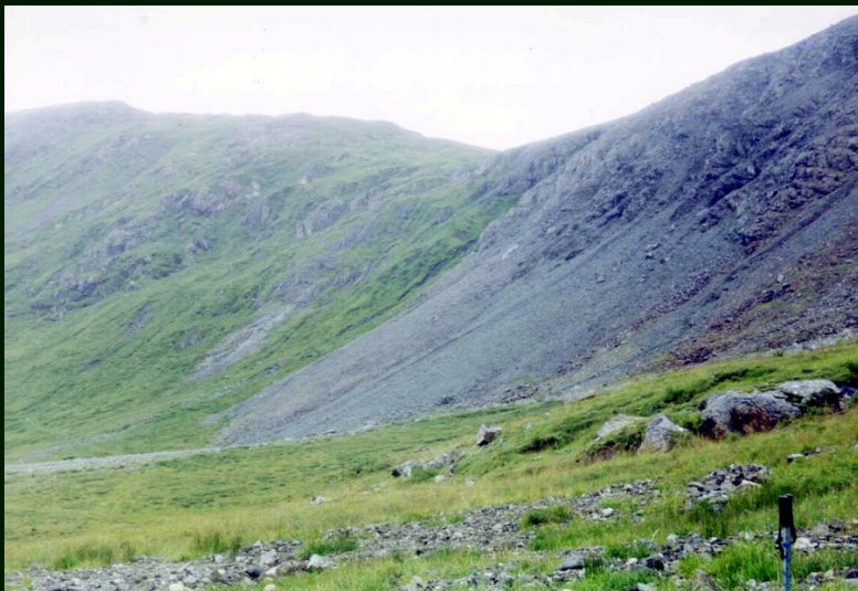
00-5-00 пер. Онотский 1А из р. Саган-Сайр