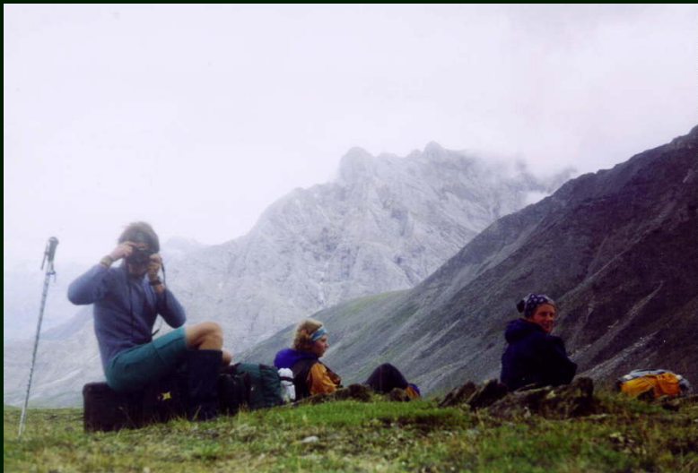
00-4-04 В долине р. правый Арашей ветер