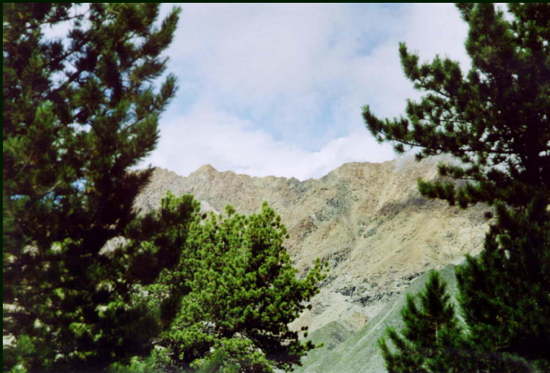
00-5-28 С левого берега реки Онот на правый