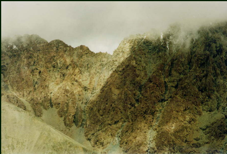
00-5-15 Вид на пер. Нефрит 2Б с пер. Зун-Тарбаган 1Б