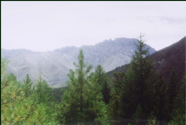
00-6-19 Долина р. Архут. Горы за р. Арашей