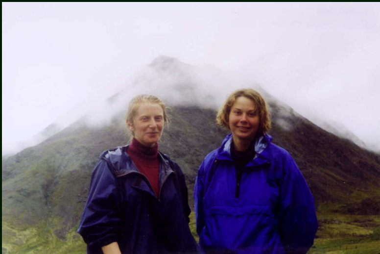
00-6-09 Девушки после холодного дождя