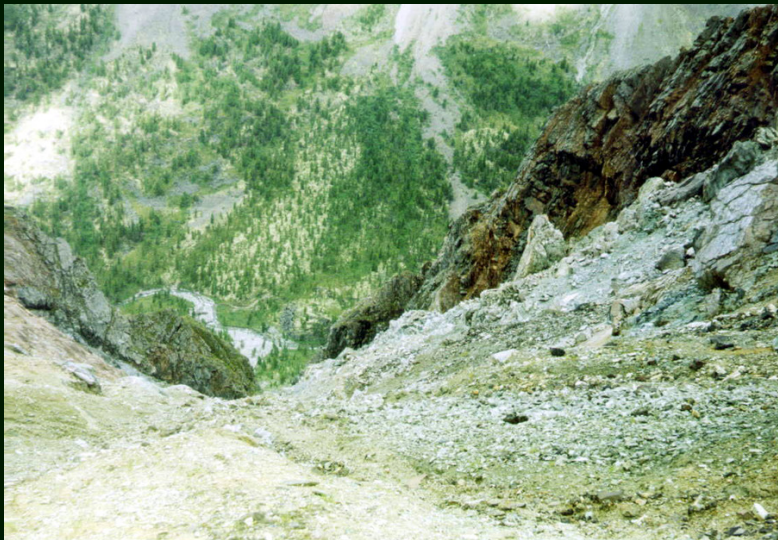
00-5-22 Вниз в р. Зун-Оспа с пер. Зун-Тарбаган 1Б