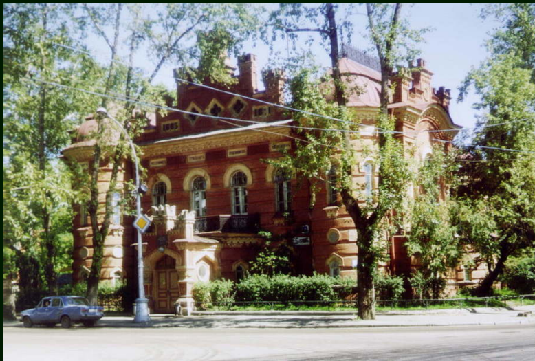
00-6-36 Иркутск. Краеведческий музей