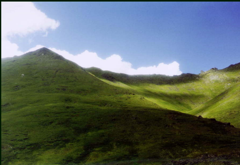
00-4-16 Правый берег р. Богохонголкой в среднем течении