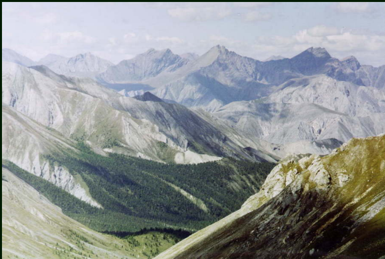
00-6-30 Фрагмент следующего кадра