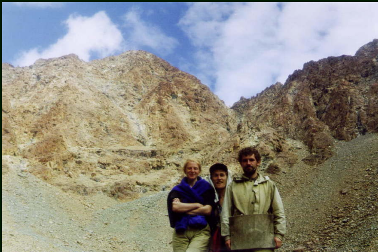
00-6-04 Автоспуск у г. Оспин-Улан-Сардык