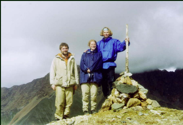
00-5-19 Первопроходители перевала Зун-Тарбаган 1Б