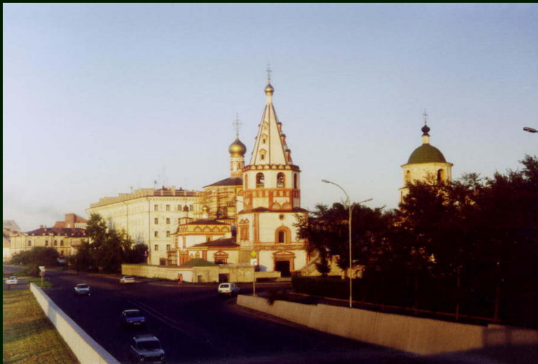
00-7-17a Иркутск. Со смотровой на Нижней набережной