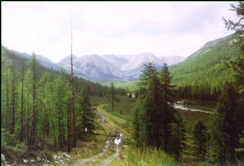
00-4-26 Вид вверх по реке Саган-Сайр