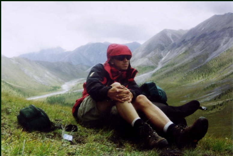
00-6-20 На перевале Девятого Блина НК ветерок