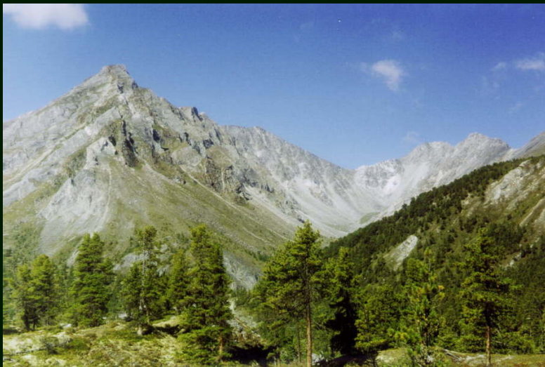
00-6-26 г. 2166 и цирк реки Дабан-Жалга, впадающей в р. Архат