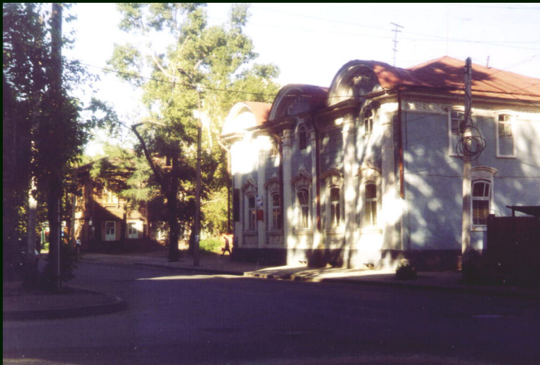
00-7-08а Иркутск. Домик в центре