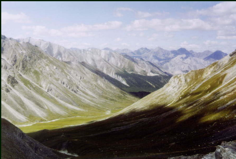
00-6-31 С перевала Хубыты на северо-запад