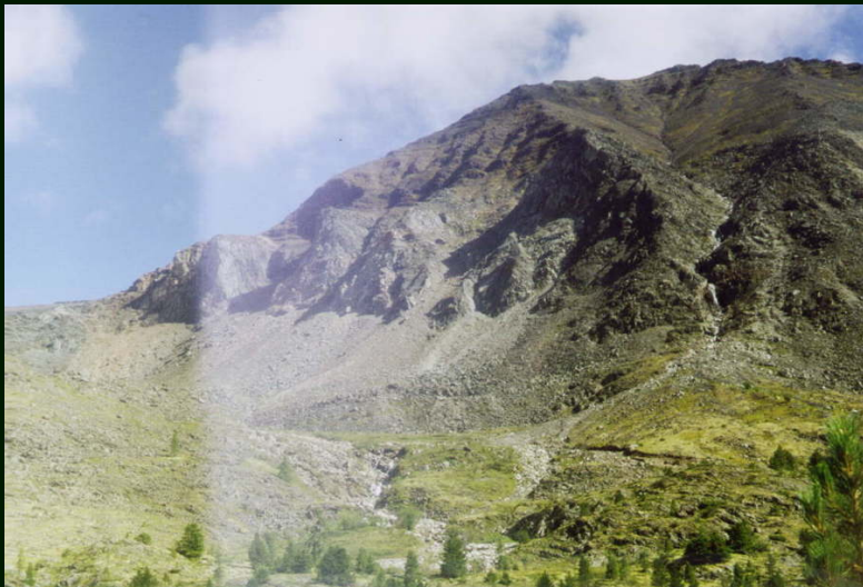
00-5-26 Верховья р. Олот, где на карте сар. Съемка на юг