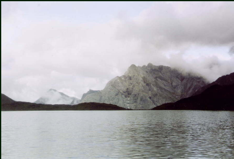
00-4-06 Вечерние съёмки гор на правом берегу р. пр. Арашей