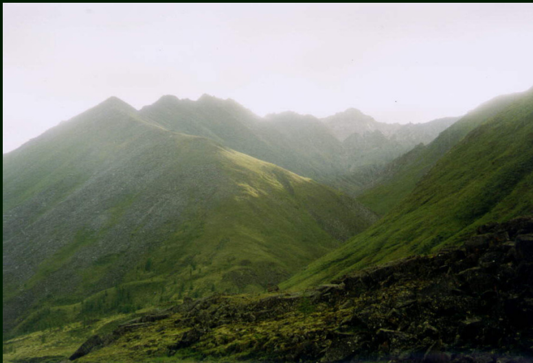
00-4-17 Утреннее солнце на правом берегу р. Богохонголкой