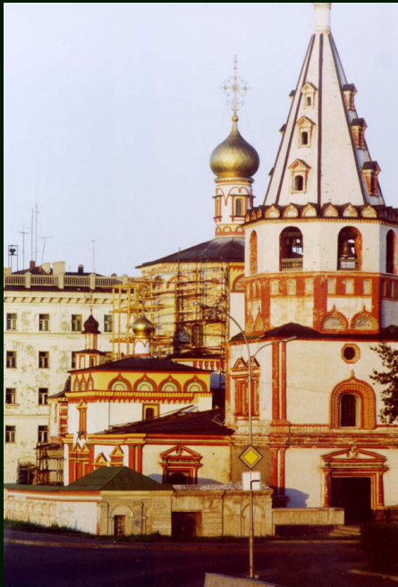
00-7-20а Иркутск. Другой храм на Нижней набережной