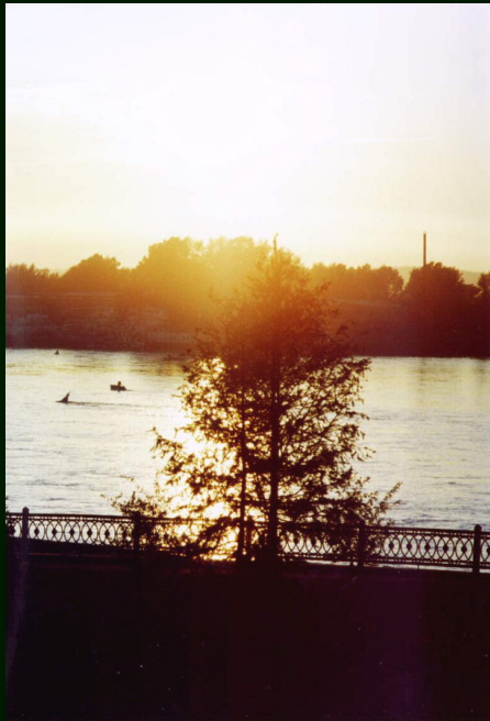
00-7-19a Иркутск. Закат на Ангаре