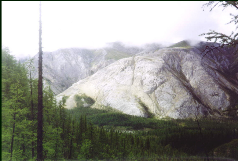
00-4-23 За рекой Китой видна дорога