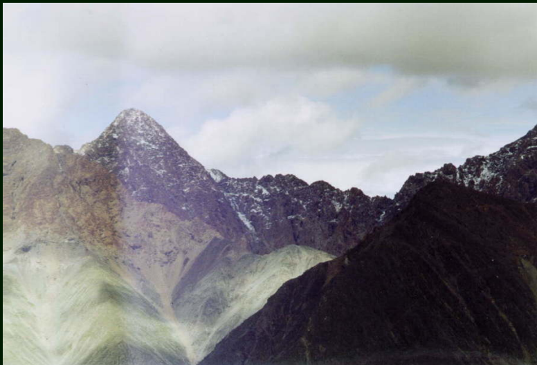
00-5-09 Кадр номер 7, только третье небо