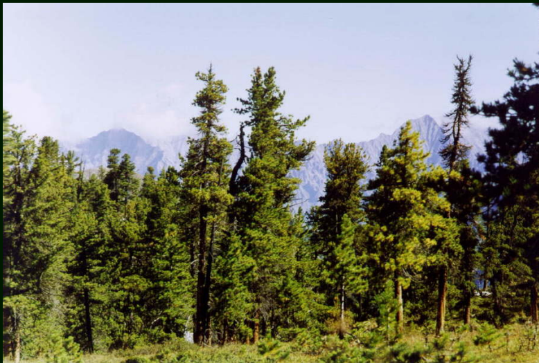
00-6-25 Лес и горы за Араошем