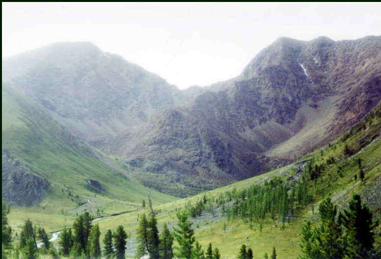
00-5-31 пер. Оспа-Дабан 2А из р. Зун-Оспа