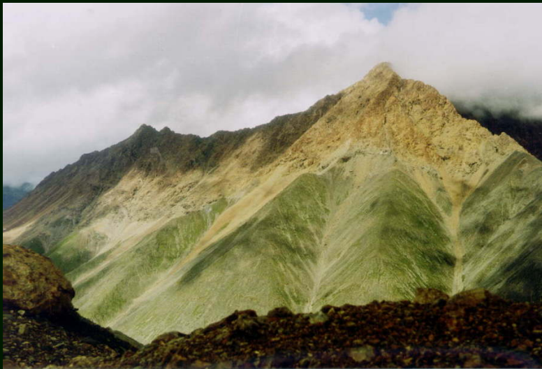
00-5-18 Сидя на пер. Зун-Тарбаган, снимаем на северо-восток