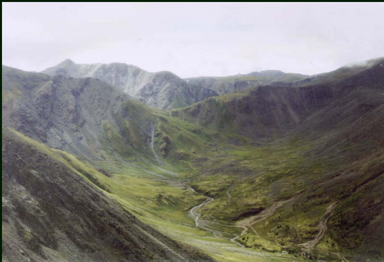
00-5-13 Перевал Онотский 1А с перевала Зун-Тарбаган 1Б