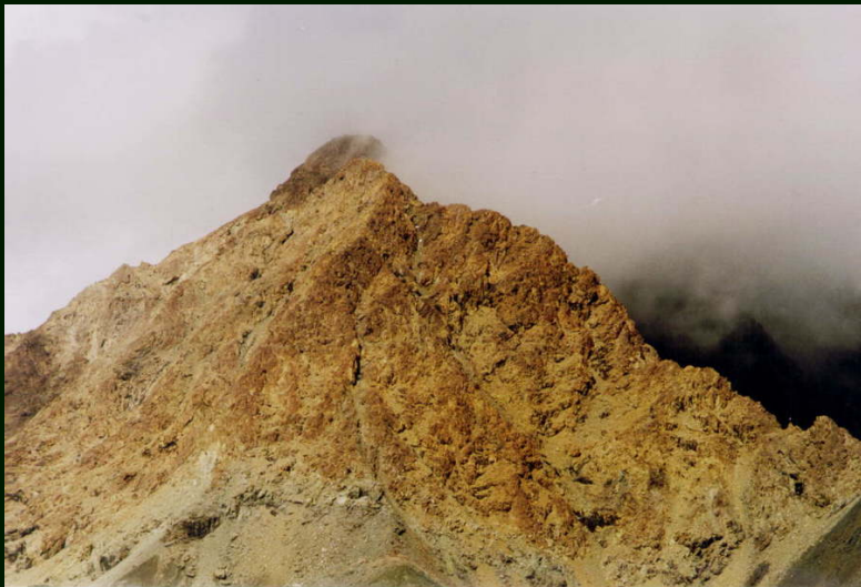
00-5-17 Облако закрыло Оспин-Улан-Сардык