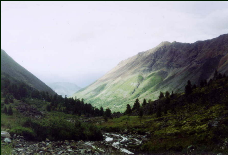
00-5-10 р. Оют. Вечернее солнце и дождь вниз по течению