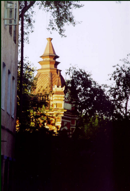
00-7-14а Иркутск. Крыло усадьбы по пути из цирка