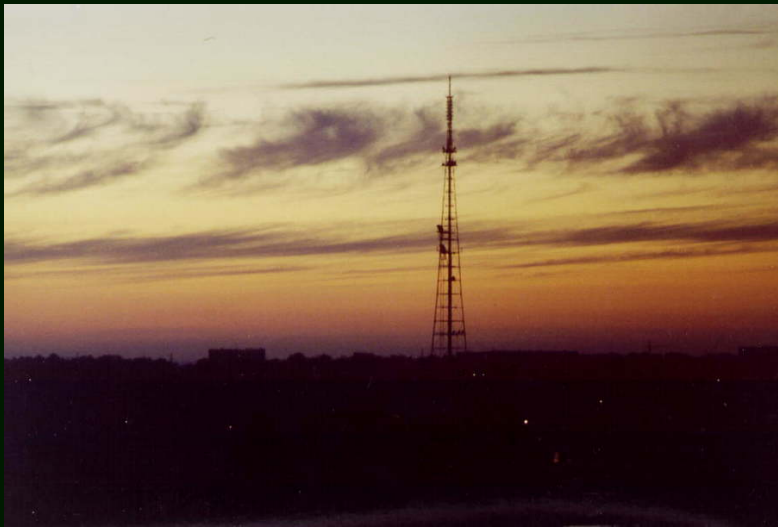
00-7-21a Иркутск. 6:10 из гостиницы Селена