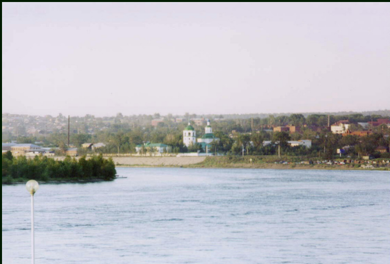
00-7-18а Иркутск. р. Ангара со смотровой Нижней набережной