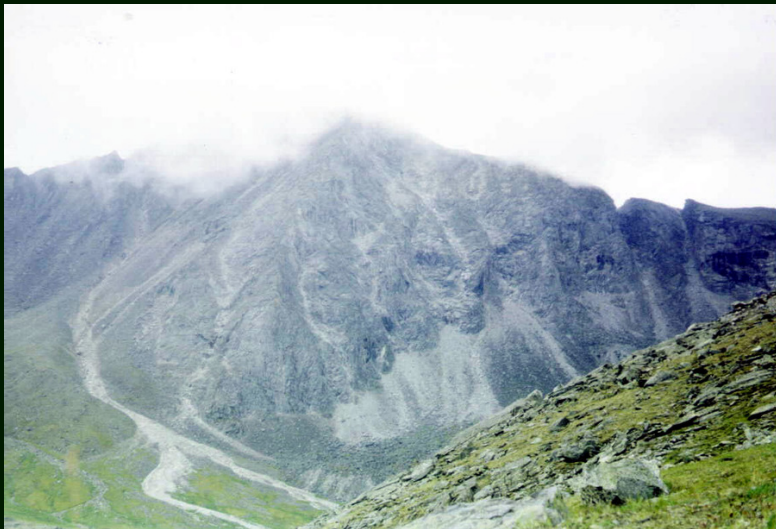
00-4-03 р. правый Араошей. пер. Уляндабан 1А от нас далеко