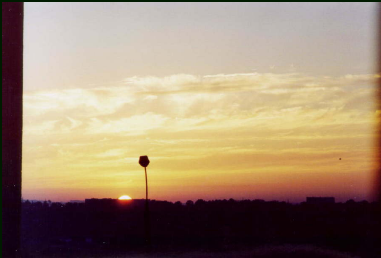
00-7-22a Иркутск. Восход из гостиницы Селена