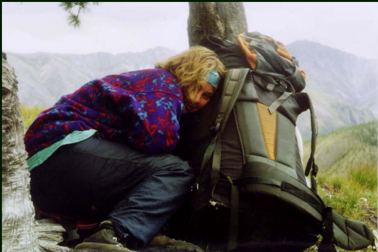
00-6-21 Прячутся от ветра на перевале Девятого Блина НК