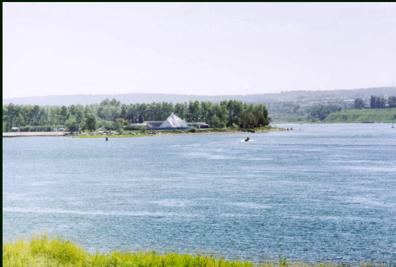
00-6-35 Иркутск. Река Ангара