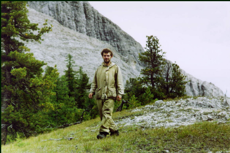
00-6-22 Походочка на перевале Девятого Блина НК