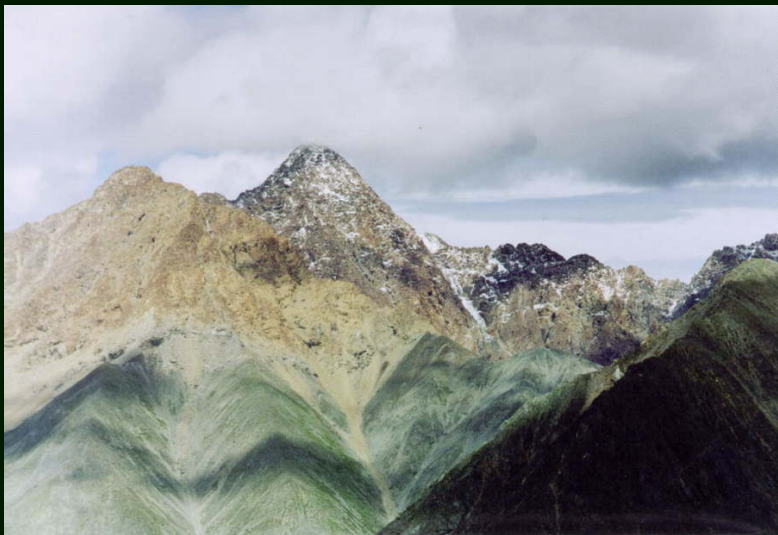
00-5-02 Кадр номер 7, другое небо