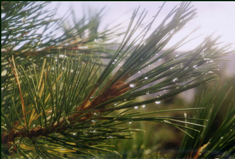
00-5-25 Кадрик после дождя