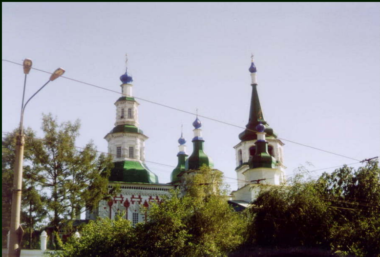
00-7-06а Иркутск. Храм на улице Коммунаров