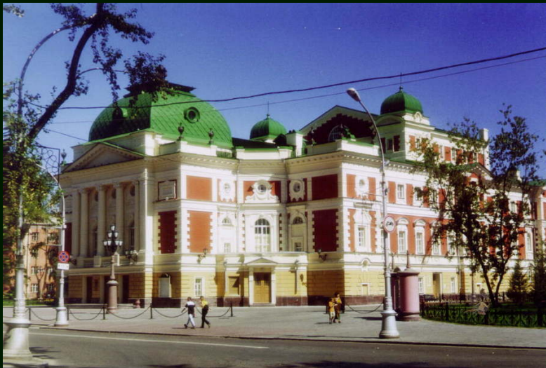
00-6-37 Иркутск. Драматический театр им. Охлопкова