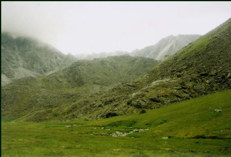
00-4-02 р. правый Арашей. правее перевала Уляндабан 1А