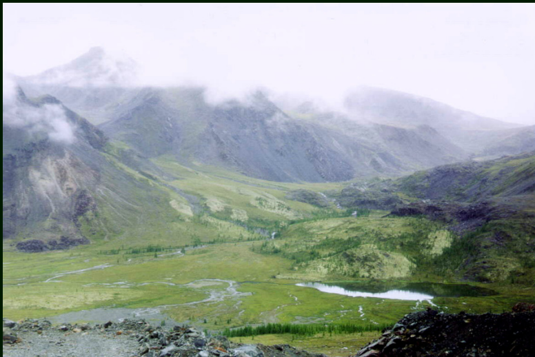
00-6-08 пер. Сагансайр НК со спуска с пер. Оспин-Дабан 1А