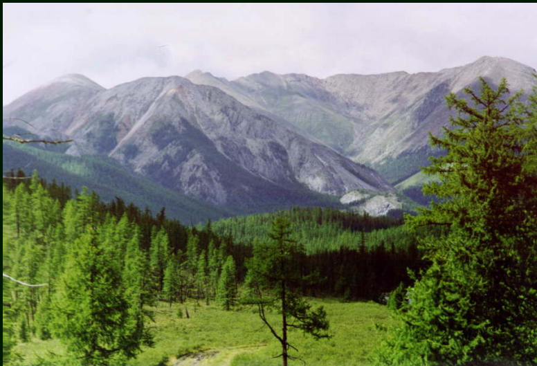
00-4-29 Художественный фрагмент кадра номер 26