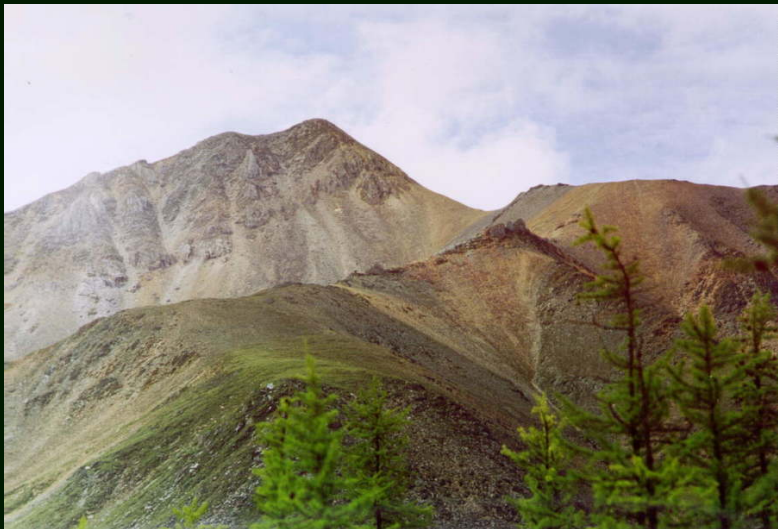
00-4-36 гора 2771 реки Саган-Сайр