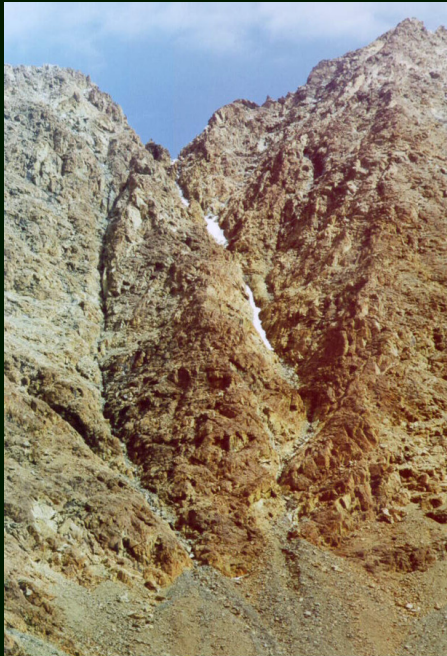
00-5-34 Перевал Нефрит 2Б (с запада на восток)