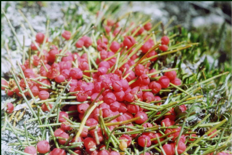
00-6-18 Это тоже цветы диаметра 5 мм