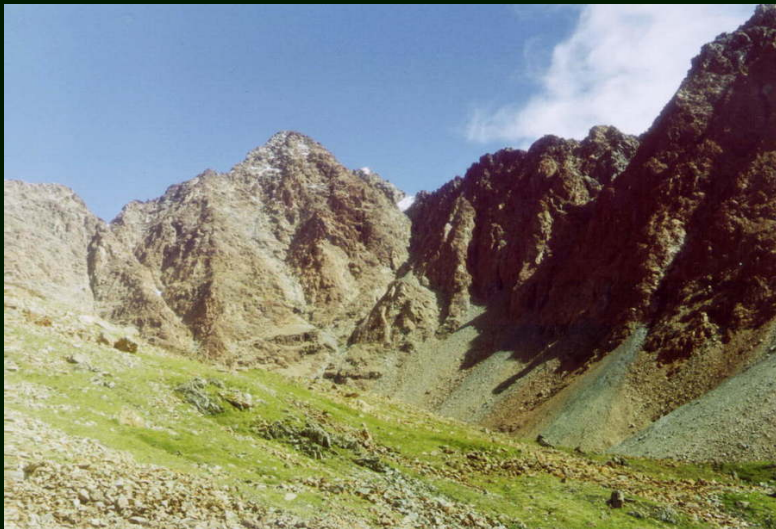
00-5-32 Массив г. Оспин-Улан-Сардык (с юга на север)