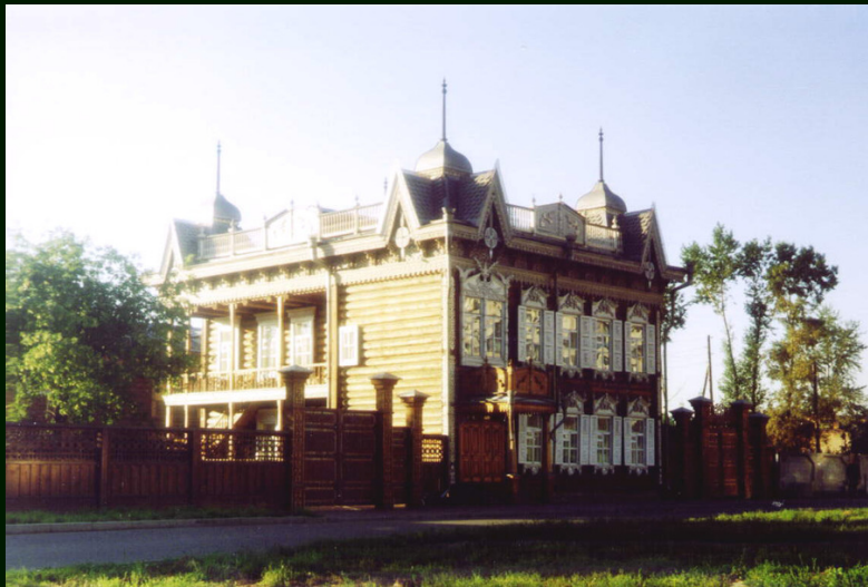
00-7-10а Иркутск. Некий дом на ул. Декабрьских событий