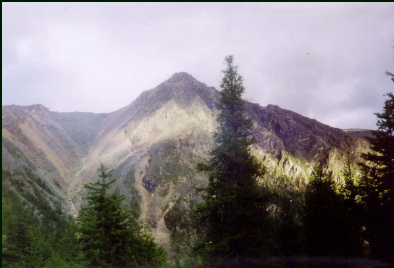
00-4-30 Вечернее время на слиянии р. Саган-Сайр и Змеевиковая