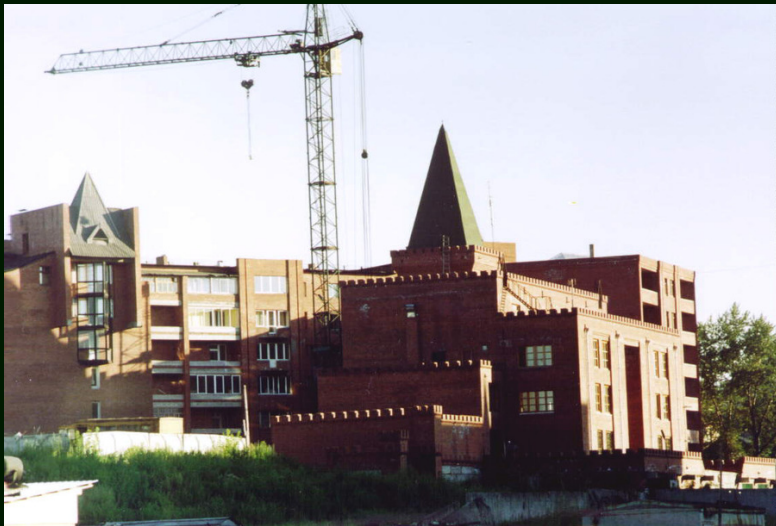
00-7-09а Иркутск. Новостройки на ул. К. Либкнехта