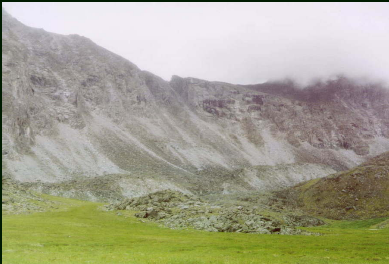
00-4-01 р. правый Арашей. пер. Уляндабан 1А