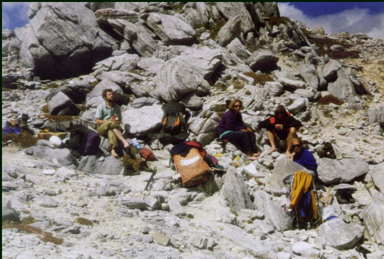
00-6-28 Фото группы на перевале Хубыты 1А