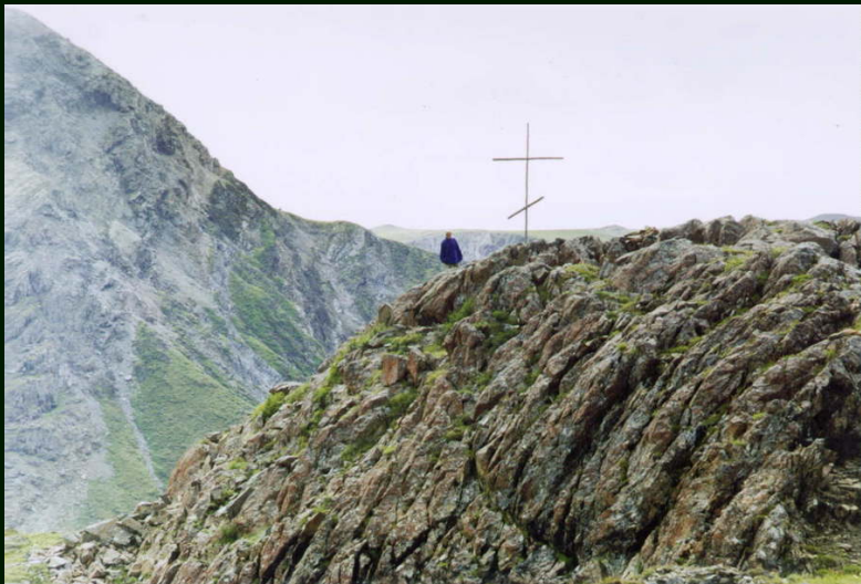
00-5-08 Крест на перевале Онотский 1А