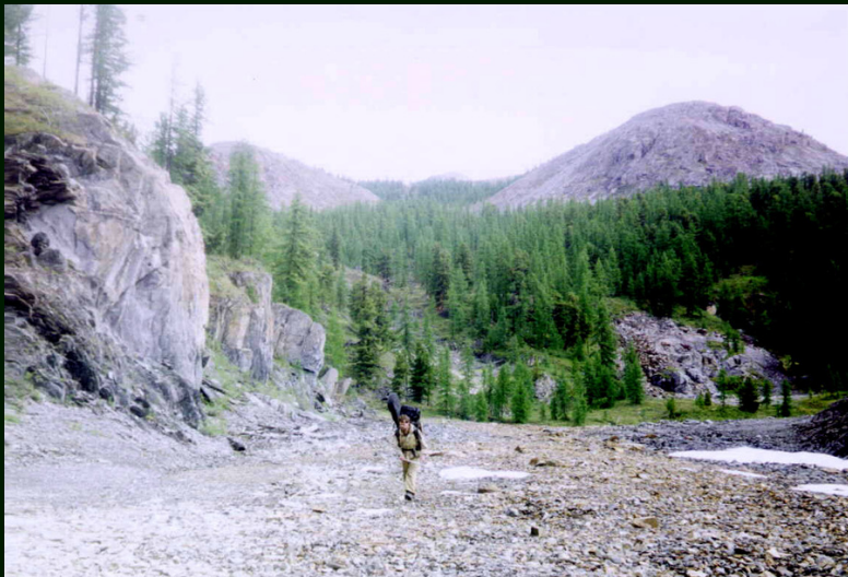
00-4-31 Гуляем в долине р. Саган-Сайр