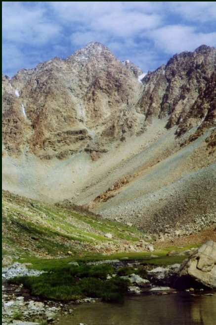
00-6-00 г. Оспин-Улан-Сардык с юга