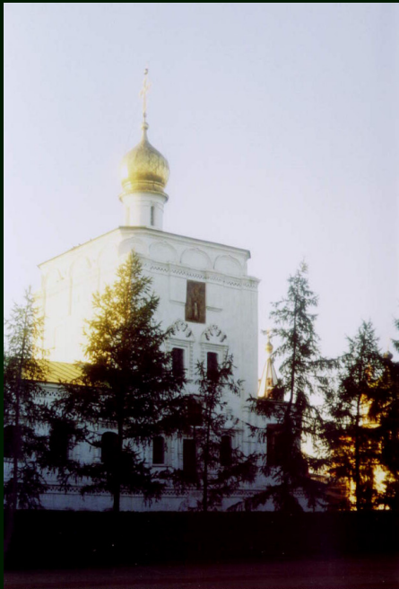
00-7-15a Иркутск. Церковь на Нижней набережной