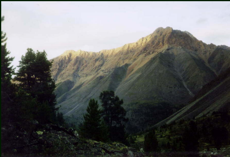
00-5-12 Вечернее позднее солнце в долине реки Орот