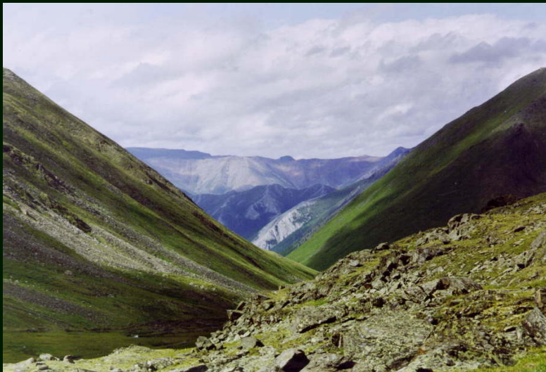
00-4-13 Долина р. Богохонголдой и 2 хребта Китайских гольцов