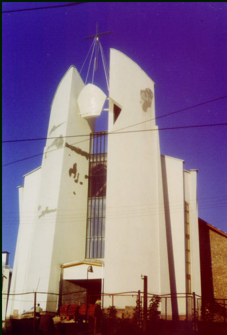
00-7-23а Иркутск. Баптистский храм возле ИПИ