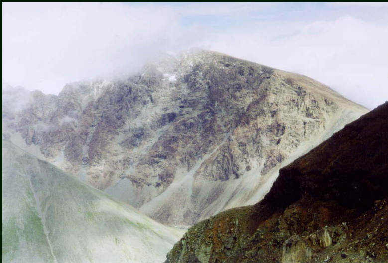
00-5-14 г. 2863 с перевала Зун-Тарбаган 1Б