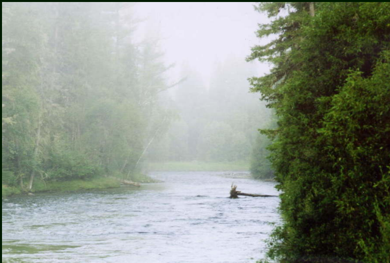
00-6-33 р. Ихеухгунь недалеко от Ниловой Пустыни