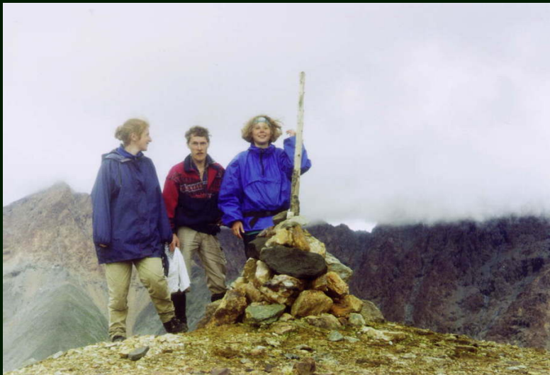
00-5-20 Речи и люди на перевале Зун-Тарбаган 1Б