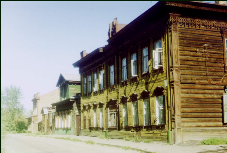
00-7-07a Иркутск. Домики на улице Коммунаров