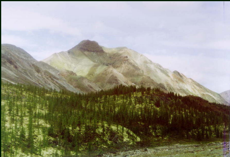
00-4-37 гора 2526 реки Саган-Сайр